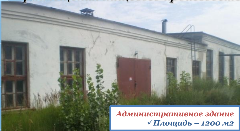
Административное здание ✓ Площадь – 1200 м2

Производственный комплекс с действующей инфраструктурой для размещения пищевого производства (площадь территории 13921 м2).