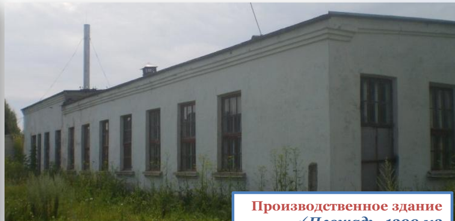
Производственное здание ✓ Площадь -1200 м2