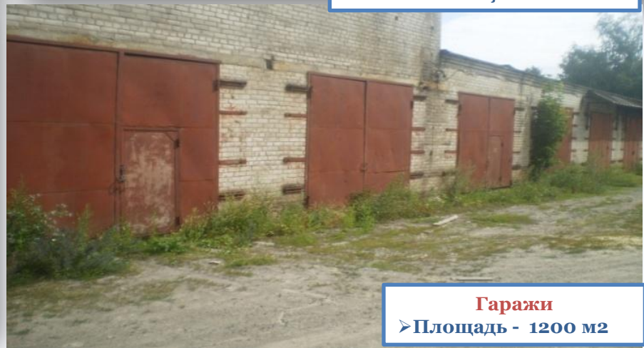
Гаражи ➤ Площадь - 1200 м2

Ранее на данной площадке располагалось ОАО «Маслозавод»