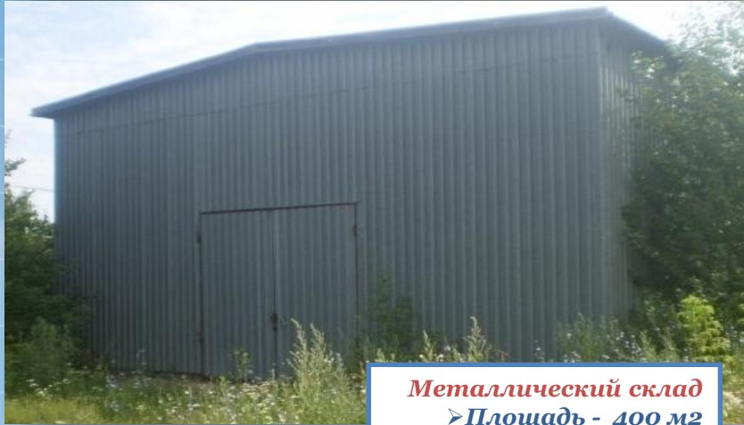
Металлический склад ➤ Площадь - 400 м2